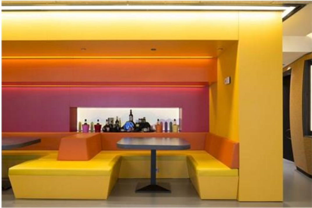
同一個空間的色彩層次，讓空間活潑有變化