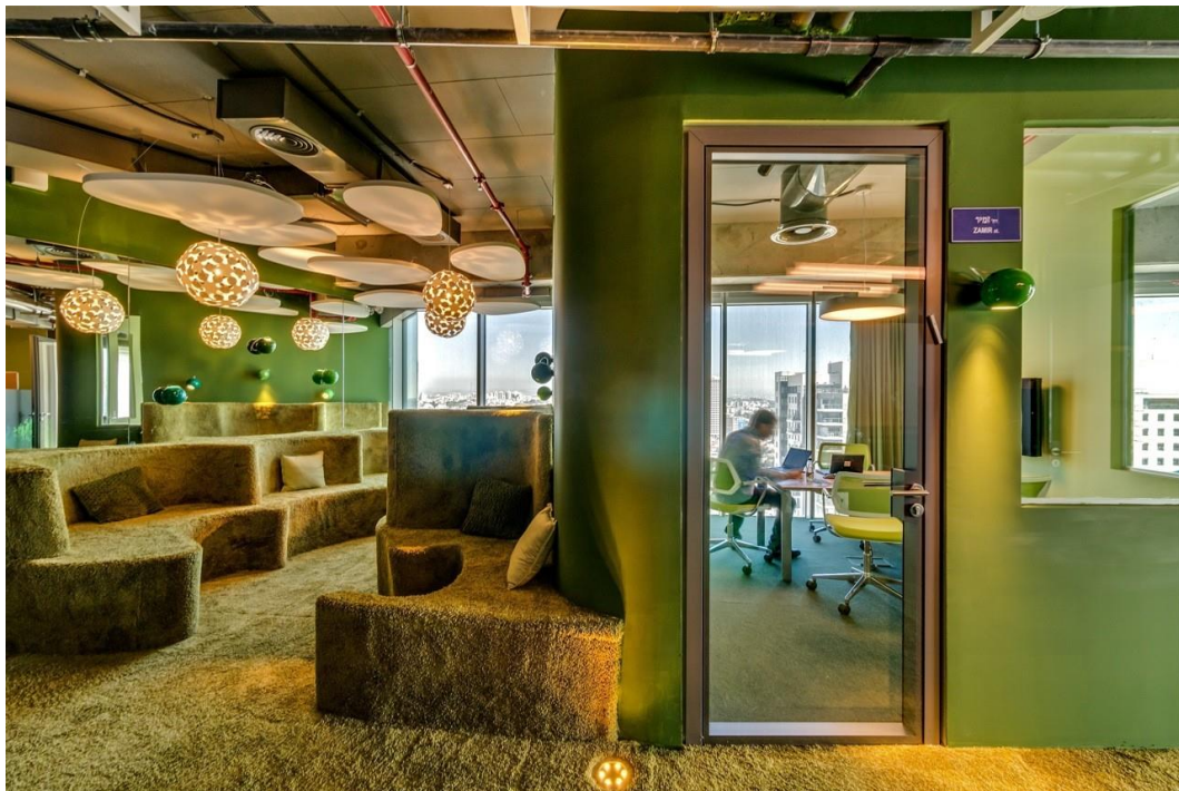
用色彩做空間管理