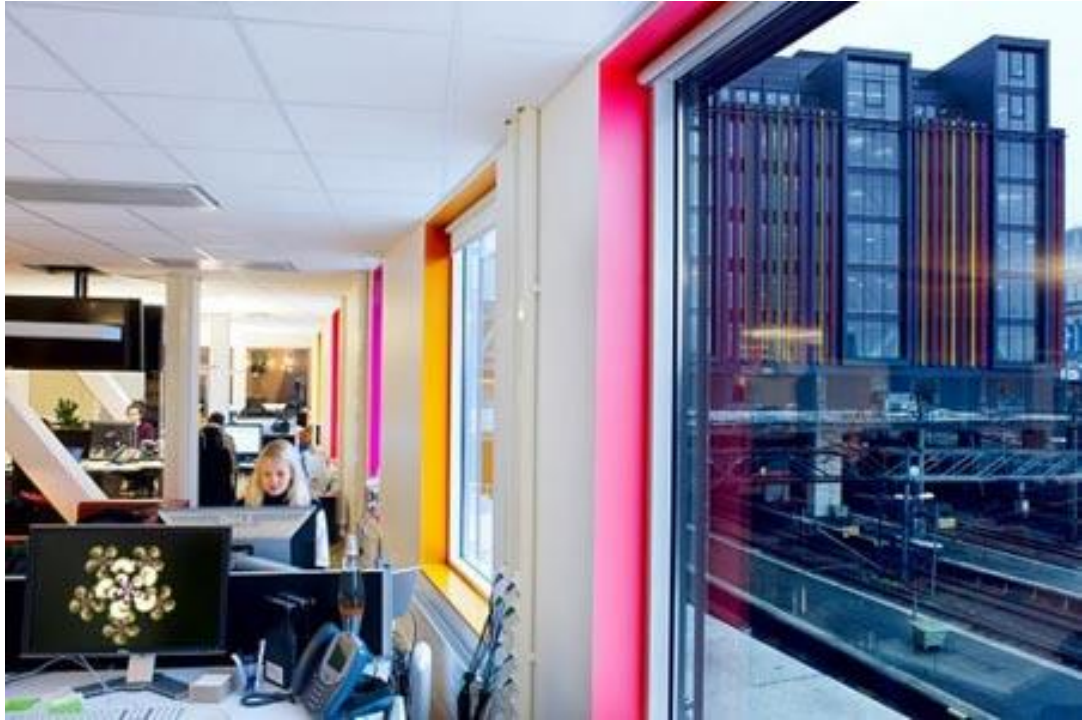
研究指出:工作環境中有窗景、植物和明亮的色彩可提升正向情緒