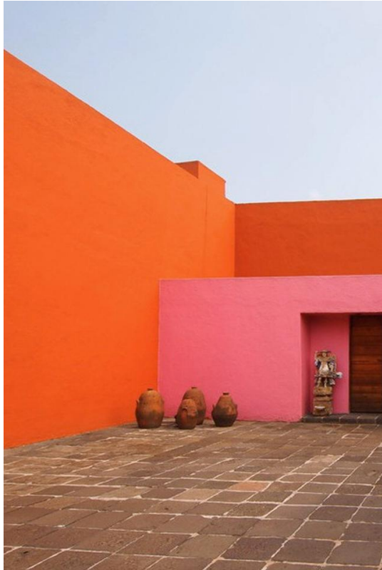
圖/聖·克裡斯特博(San Cristobal)馬廄與別墅