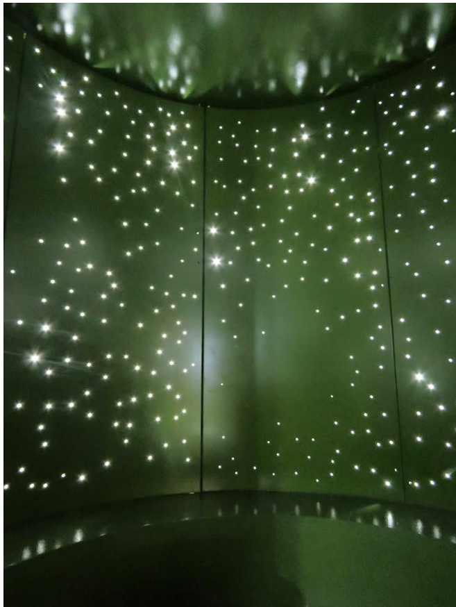
墨綠色用於光點體驗室，用光與色彩呈現奇幻效果