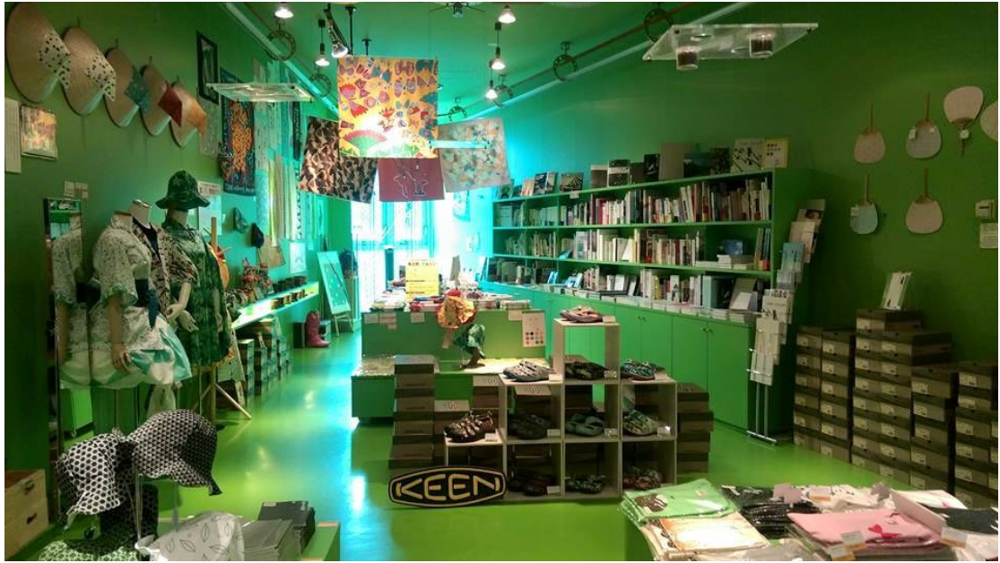
翠綠色賣店襯托展售藝術品與農產品