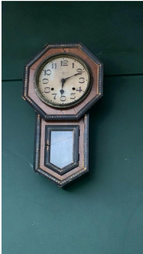
墨綠色牆面襯托老時鐘別有風味